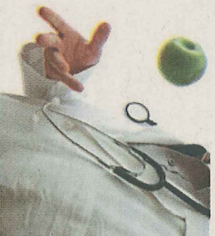
要成为加拿大注册营养师，必须过三关。

了与当地营养师管理局注册的资格 (卑诗省是: College of Dietitians of British Columbia)。注册名单每年都会更新。